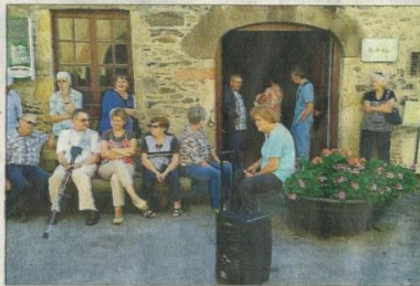
A Prévinquières, les visiteurs immergés entre présent et passé.

Un parcours sonore est constitué de huit points d'écoute, le Portail Haut, l'Église, le Tinal, l'École, la Forge, un point sur l'élevage en descendant la route vers le Pont, le Maquis, et enfin