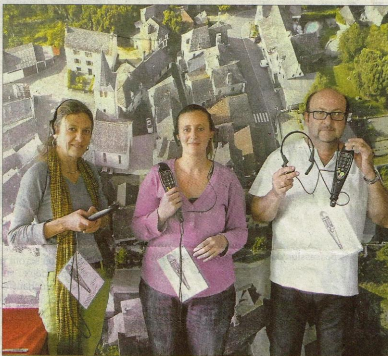
Cinq audioguides sont disponibles au Relais de Prévinquières. Chacun d'entre eux peut être utilisé par deux personnes à la fois.

Un projet résolument moderne puisqu'on peut aussi télécharger les sons sur Internet avant de partir, voire flasher les QR codes avec un smartphone sur les bornes placées un peu partout dans le village. Les documents sonores offrent le témoignage de maquisards, d'anciennes élèves de l'école de filles, de l'ancien maire du village, du maire actuel, mais aussi de l'ancienne institutrice et de l'actuelle boulangère