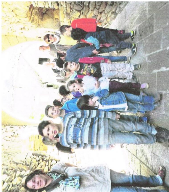
Les écoliers se sont pleinement investis dans un parcours sonore pour enfants.