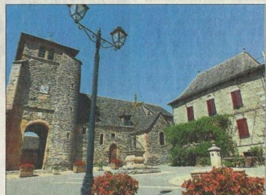
L'église St Jean Baptiste à La Bastide l'Évêque.