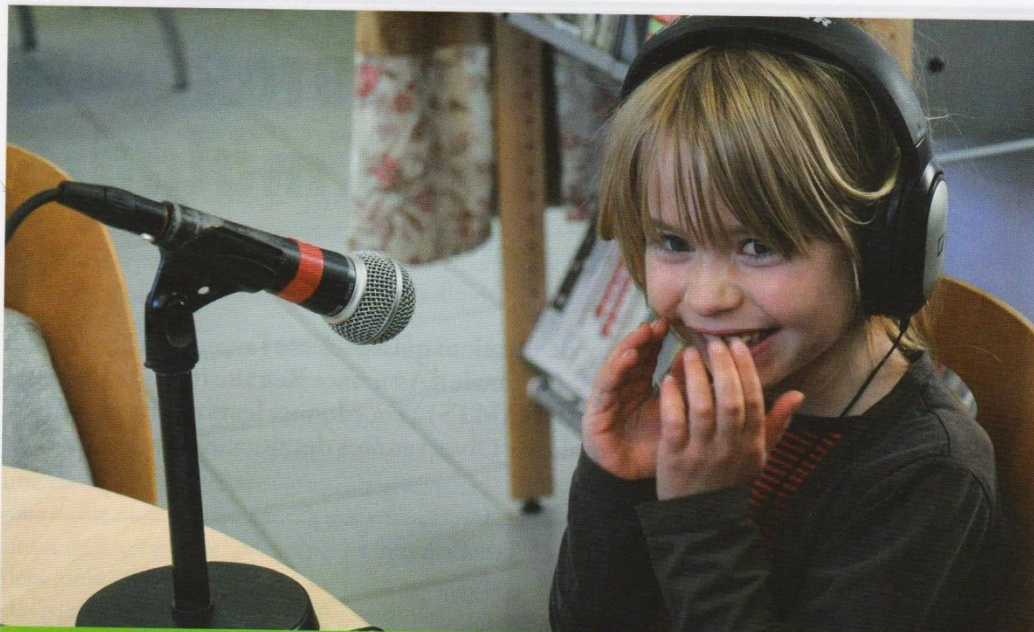
Par le son, les enfants découvrent la richesse du lien avec les personnes âgées