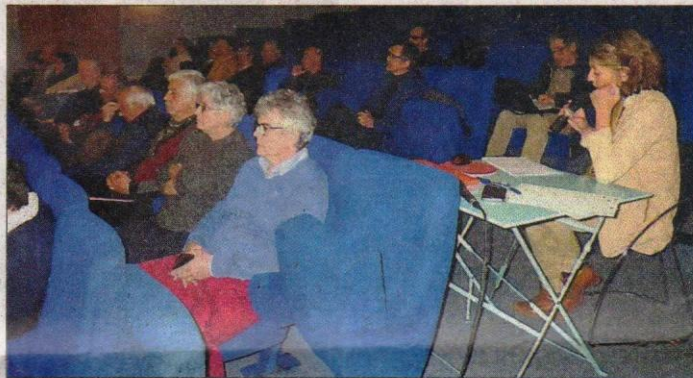
Une trentaine de personnes étaient réunies pour le lancement de la 2 e phase d'Oreilles en Balade.

Une trentaine de personnes a ainsi pu débattre autour du projet « Oreilles en balade », qui entame là phase 2 pour pouvoir s'étendre dans plusieurs communes du Pays d'art et d'histoire (10 au total dont Rieupeyrou, La Salvetat, Vabre-Tizac, St Salvadou, La Bastide l'Évêque...), et dans un certain nom-